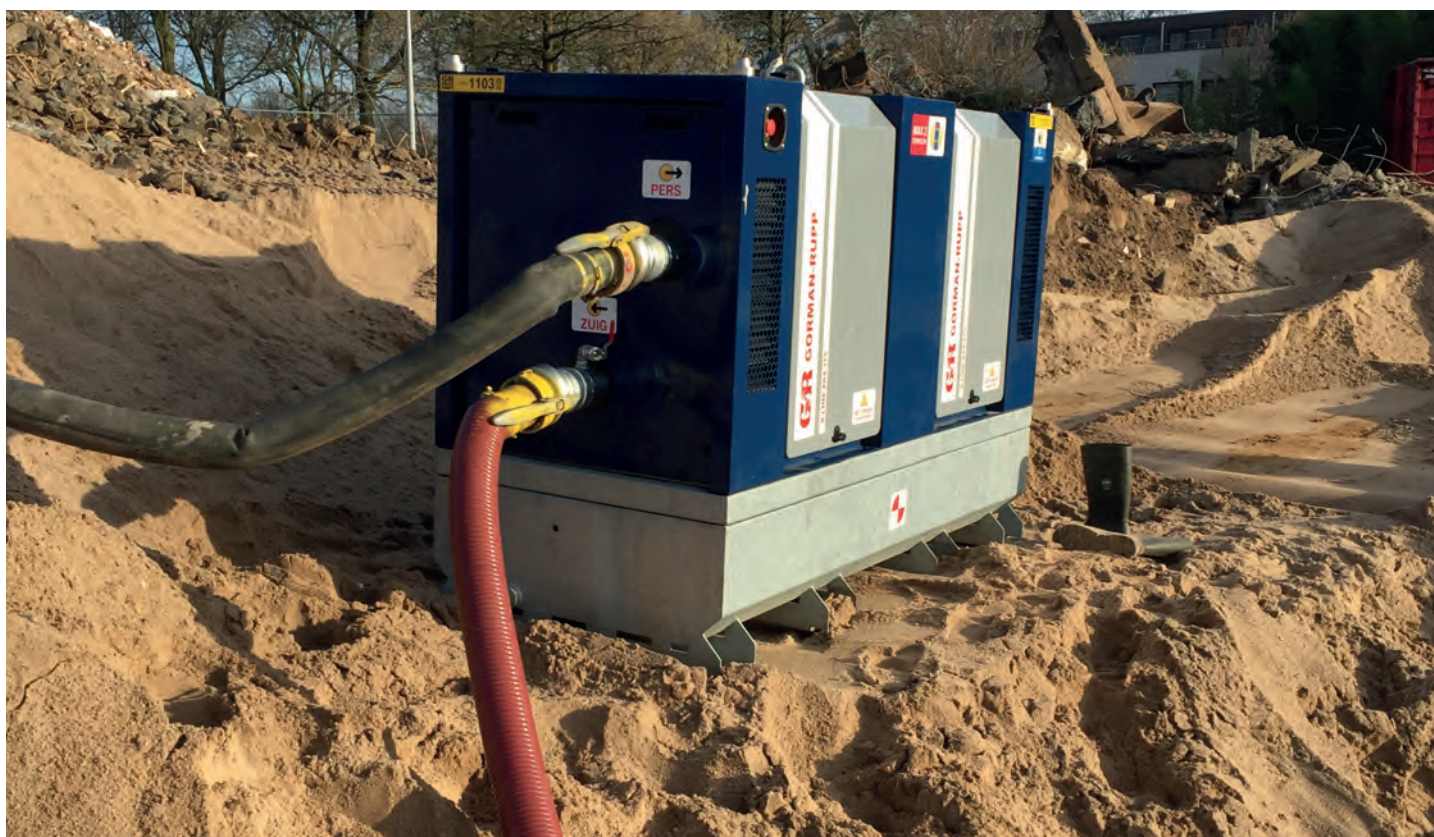
Gorman-Rupp Europe speelt een grote rol in de verhuur van mobiele pompinstallaties aan de GWW-sector, industrie en de overheidsmarkt.

De naam Archy is afgeleid van de schroef van Archimedes, een van de oervormen van de pomp. Maar het is ook