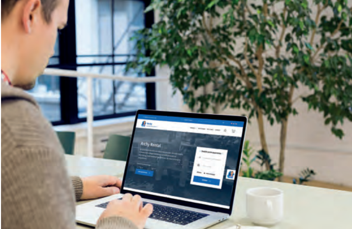
Via Archy-platform kan de klant in deze digitale omgeving eenvoudig een geschikte pomp selecteren en reserveren.