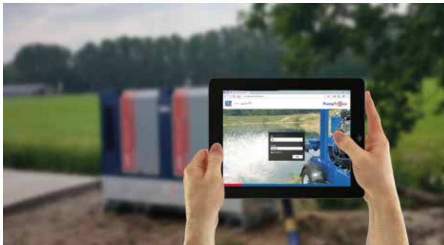
Met het online monitoringssysteem PumpTr@xx heeft de eigenaar van een pomp altijd volledige controle over zijn machines: zelfs als deze zich op een locatie aan de andere kant van het land bevinden.

"We doen natuurlijk niet alleen investeringen in onze organisatie en in ons servicenetwerk, we besteden ook erg veel tijd aan productinnovatie. Een voorbeeld daarvan is ons online monitoringssysteem PumpTr@xx. Dit systeem is nu uitgerold op alle pompsets die we aanbieden. Ook zijn we nog steeds een van de weinige aanbieders die een volledige lijn aan EU Stage V dieselaangedreven pompsets kan bieden. We zijn daarvoor een samenwerking aangegaan met Kohler, die speciaal voor onze pompsets dieselmotoren bouwt. Interessant om te vermelden is dat deze motoren ook op biobrandstoffen als HVO of GTL draaien, iets dat we steeds vaker zien. En tegelijkertijd leveren we ook een volledige lijn aan elektrisch aangedreven pompsets. Daarmee kan de rioleringsaannemer in principe voldoen aan beperking van emissies – als dat vereist wordt door de opdrachtgever. Het kan voor aannemers interessant zijn om in deze ontwikkeling mee te gaan, omdat ze aanbestedingsvoorwaarden krijgen (CO 2 -prestatieladder i.c.m. EM-VI-aanbestedingen)."